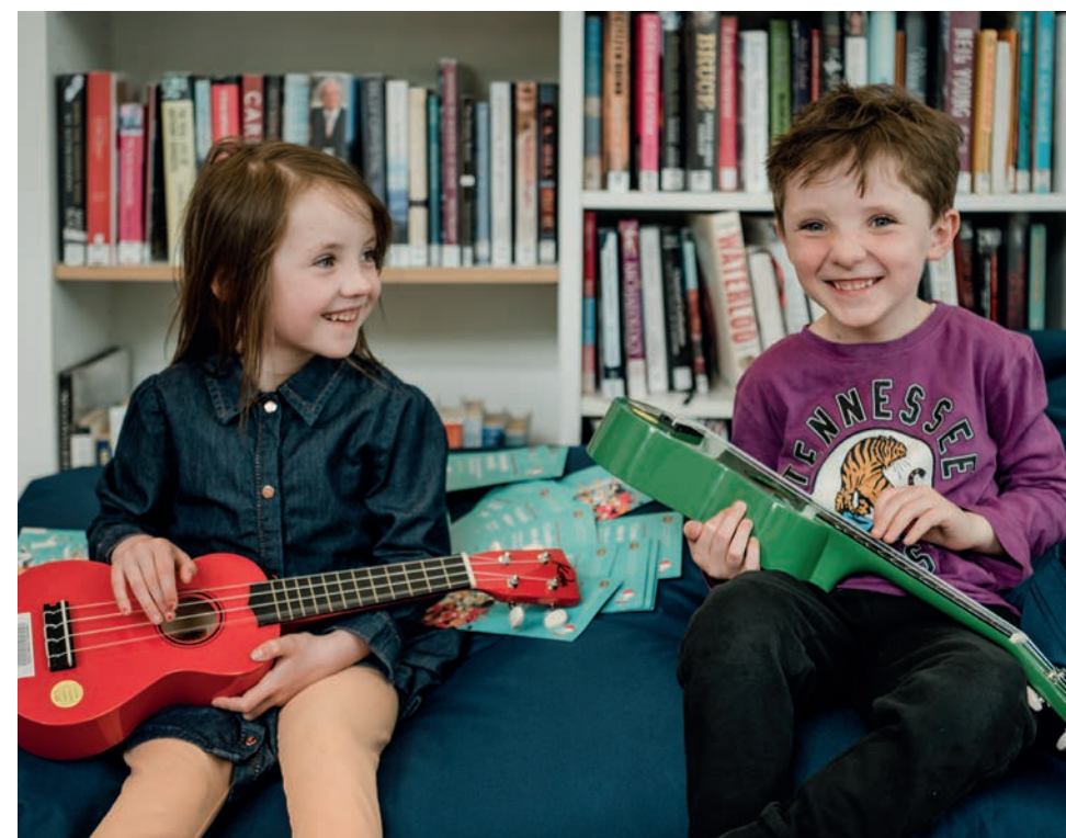
Cruinniú na nOg 2022.