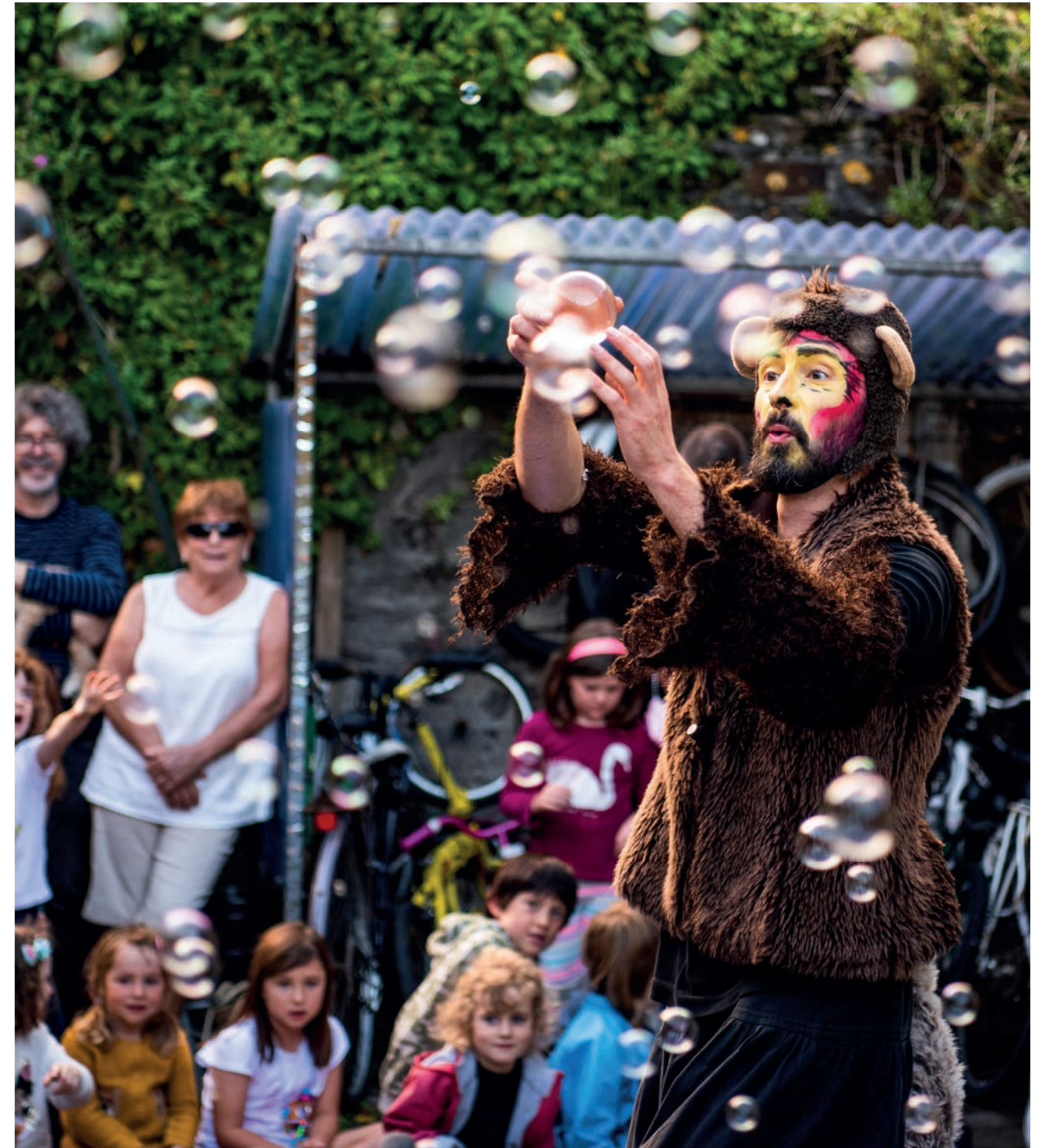
Bike Circus Clonakilty 2021.

Trí Chomhforbairt Áite Straitéiseach a shainithint mar thosaíocht straitéiseach, is é an aidhm atá againn tairbhe a bhain as sócmhainní agus leasa cultúrtha éagsúla chun tacú leis an gcuspóir foriomlán