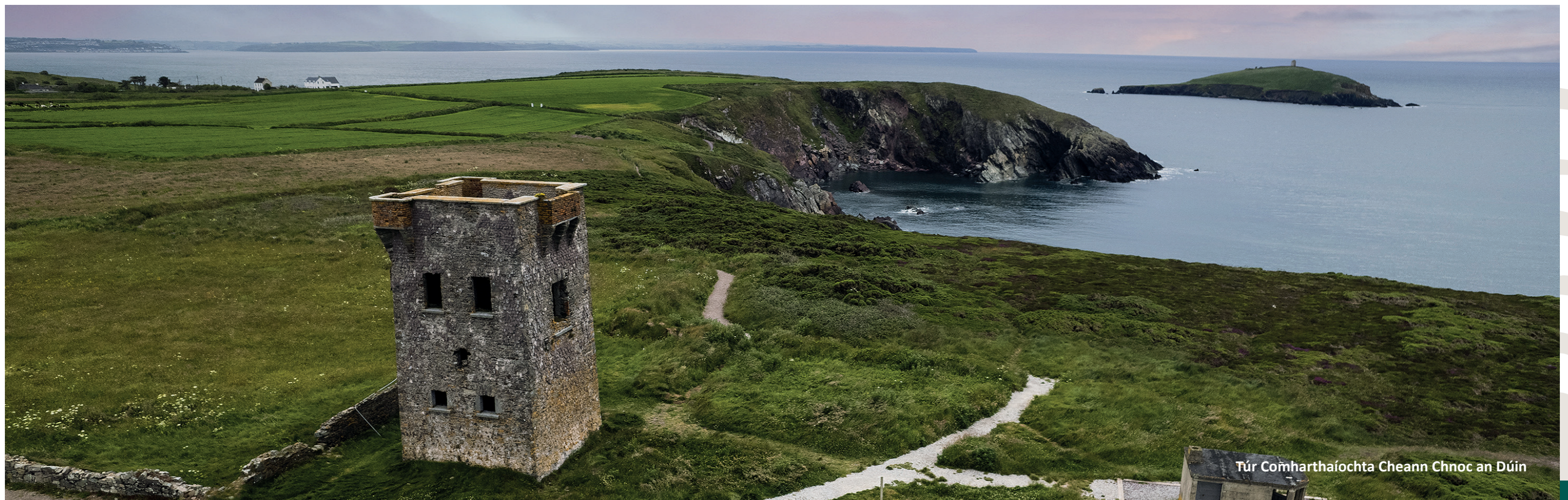
Túr Comharthaíochta Cheann Chnoc an Dúin