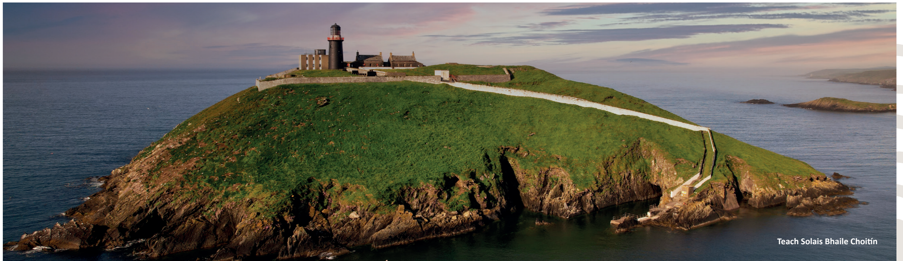
Teach Solais Bhaile Choitín

Chun é seo a chumasú, tugtar faoi deara sa phlean forfheidhmithe nuair a bhaineann gníomhartha go sonrach le ceantar rannach ar leith, cibé an bhfuil fócas ar fud na tíre aige nó i gcásanna áirithe fócas ar fud an chontae agus ar fud na rannach araon. Tabharfar faoi obair chun córas comhtháite a fhorbairt chun a chinntiú go mbeidh sé éasca tuairisciú a dhéanamh faoin struchtúr seo.